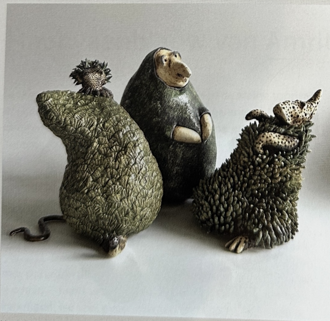
Hansje Aelvoet, Rariteiten , 2024; steengoed; h. 20 x 13 x 14 cm elk

Ik bouw beelden op zoals je een vaas opbouwt: van onder naar boven, werkend in een holle vorm. De decoraties voeg ik toe als het beeld compleet is. Ik stook mijn beelden in een elektrische oven, in mijn atelier. Na de